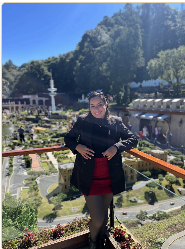
Mini Mundo, uma das paradas do primeiro dia

Pensando em viajar por menos dias? É possível criar um roteiro de 3, 4 ou 5 dias igualmente incrível — a chave é priorizar bem. Se quiser uma sugestão personalizada para o seu número de dias, perfil e companhia, é só falar com a agência . Montamos o roteiro certo para você.