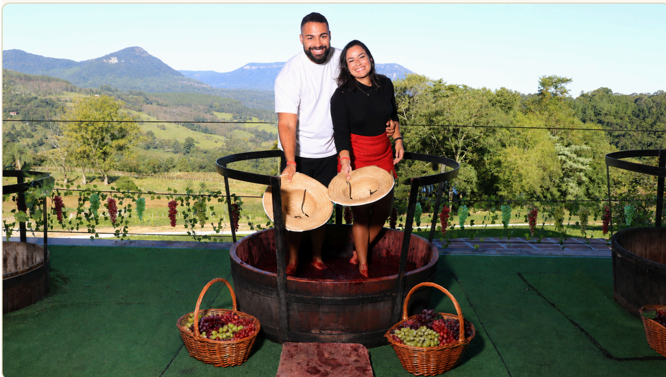
Enoturismo: a tradicional pisa da uva na Serra Gaúcha

As vinícolas Jolimont e Ravanello oferecem tours pelos vinhedos e adegas, com degustação de vinhos e espumantes. A Jolimont tem uma das vistas mais bonitas da região; a Ravanello é mais intimista e especializada em vinhos finos de alta qualidade.