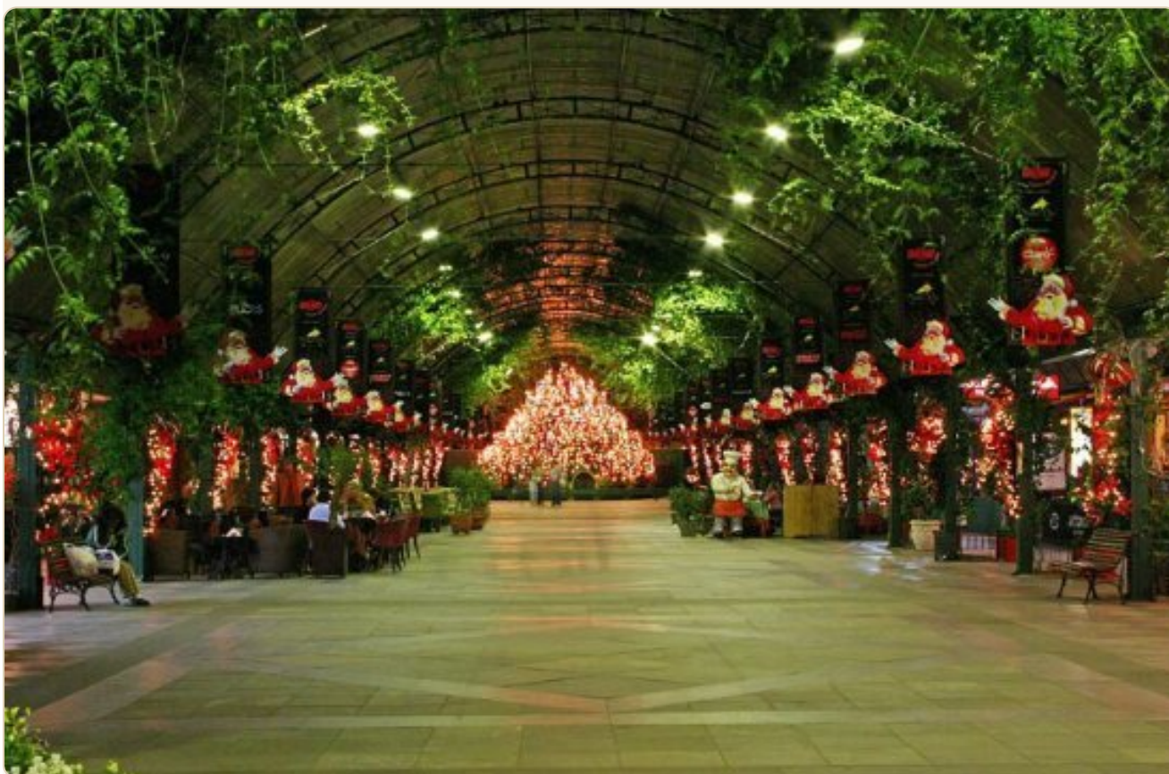
A Rua Coberta, no coração de Gramado

Este mini guia foi criado para te ajudar a aproveitar cada segundo desse destino — sem desperdício de tempo, sem tropeçar em pegadinhas de turista e sem deixar para trás nenhum dos momentos que fazem essa viagem ser inesquecível.