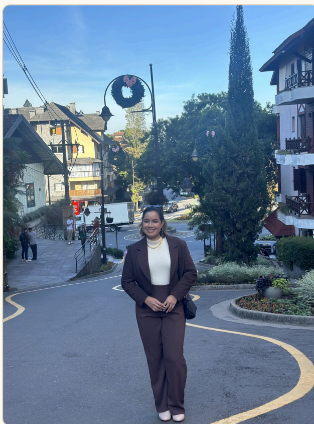
A Rua Torta — a "Lombard Street brasileira"

Praça das Flores + Labirinto Verde → Parque Aldeia do Imigrante → almoço típico alemão → Parque Pedras do Silêncio → Ninho das Águias (mirante) → retorno.