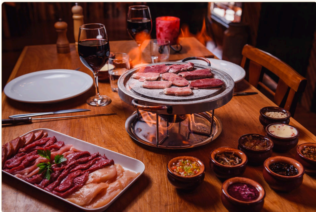
O fondue: o ritual gastronômico que define uma noite fria na Serra

Se tem uma experiência que define Gramado, é um jantar de fondue numa noite fria. Uma dica importante: escolha uma roupa que você não vai usar no dia seguinte. A fumaça do fondue impregna tecidos e cabelos — e isso faz parte do charme, mas é bom estar preparado.