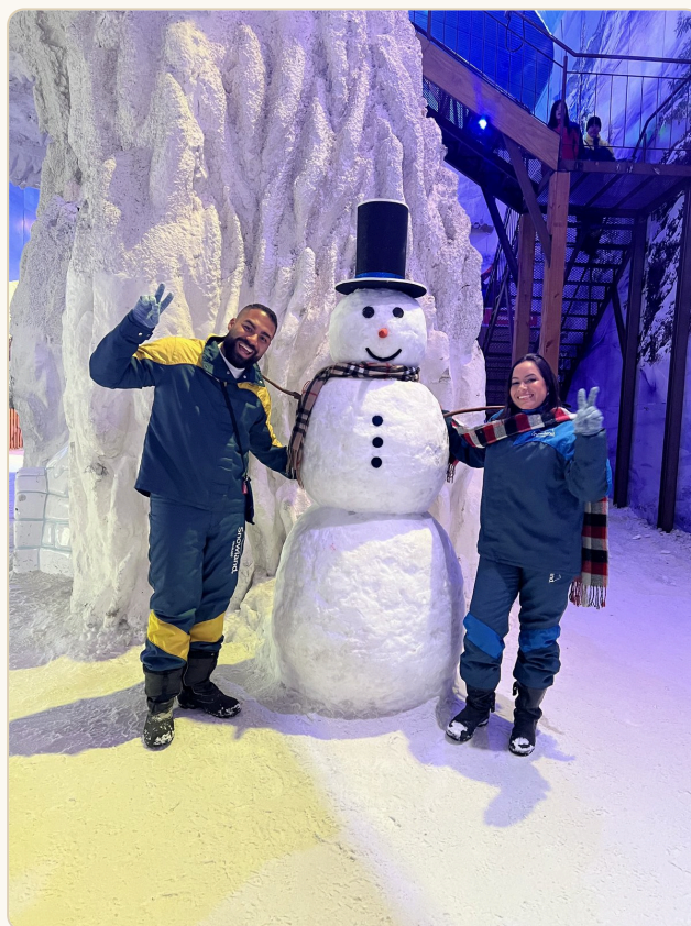
Snowland — o parque de neve indoor

Uma das experiências mais únicas que você vai ter no Brasil. O Snowland mantém a temperatura em 15 graus negativos e oferece esqui, snowboard, patinação no gelo e área kids com neve de verdade. Vista roupas térmicas mesmo que seja verão lá fora — as roupas do parque protegem da umidade, mas não aquecem.