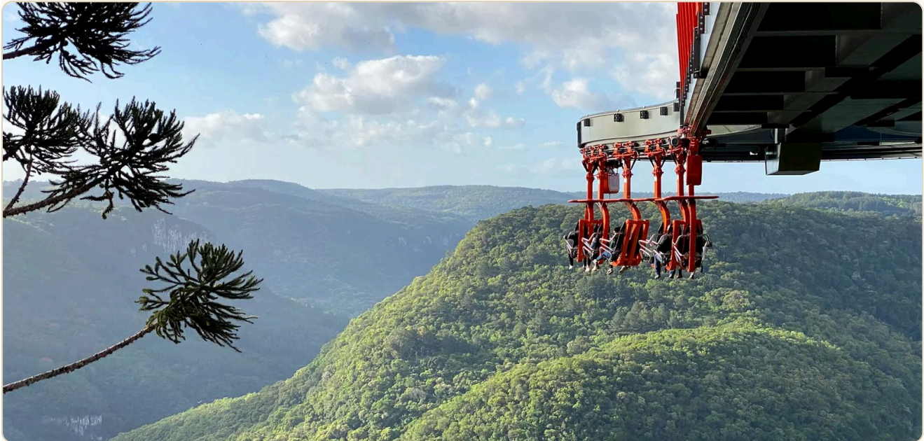
O Vale da Ferradura, visto dos bondinhos aéreos

Sobrevoar o Vale da Ferradura e contemplar a Cascata do Caracol de cima é uma das imagens que ficam para sempre. O complexo ainda tem plataformas suspensas, tirolesa e muito espaço para fotos.